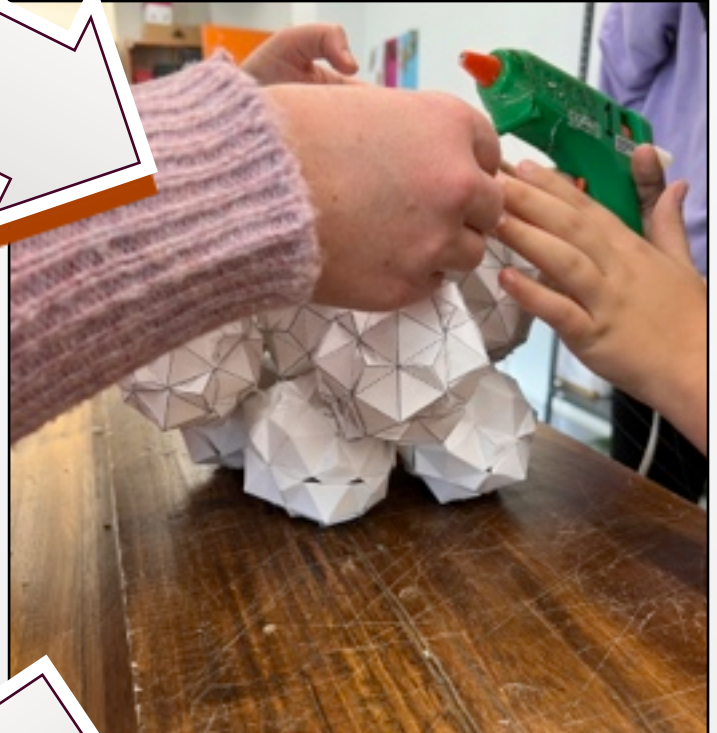
PEGÁMOLAS CON SILICONA