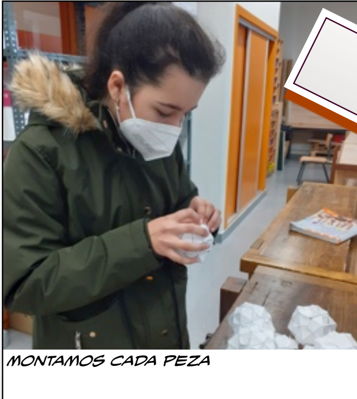
MONTAMOS CADA PEZA