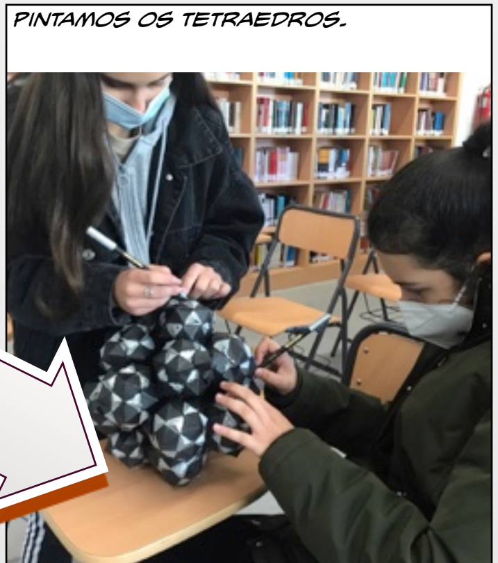
PINTAMOS OS TETRAEDROS.